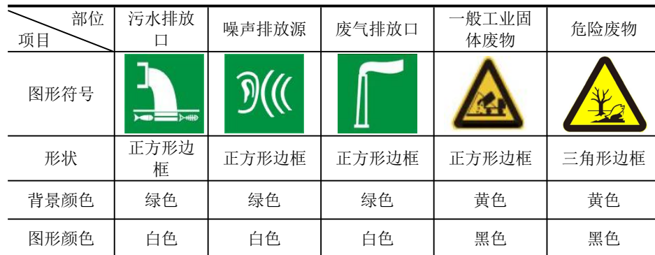
表 5-1 排污口图形符号（提示标志）一览表

排放口应预留监测口做到便于采样和测定流量，并设立标志，执行《环境图形标准排污口（源）》（GB15563.1-1995）、《危险废物识别标志设置技术规范》（HJ1276-2022）、《环境保护图形标志-固体废物贮存（处置）场》（GB15562.2-1995）及其2023年修改单要求，具体详见下表5-1。标志牌应设在与之功能相应的醒目处，并保持清晰、完整。